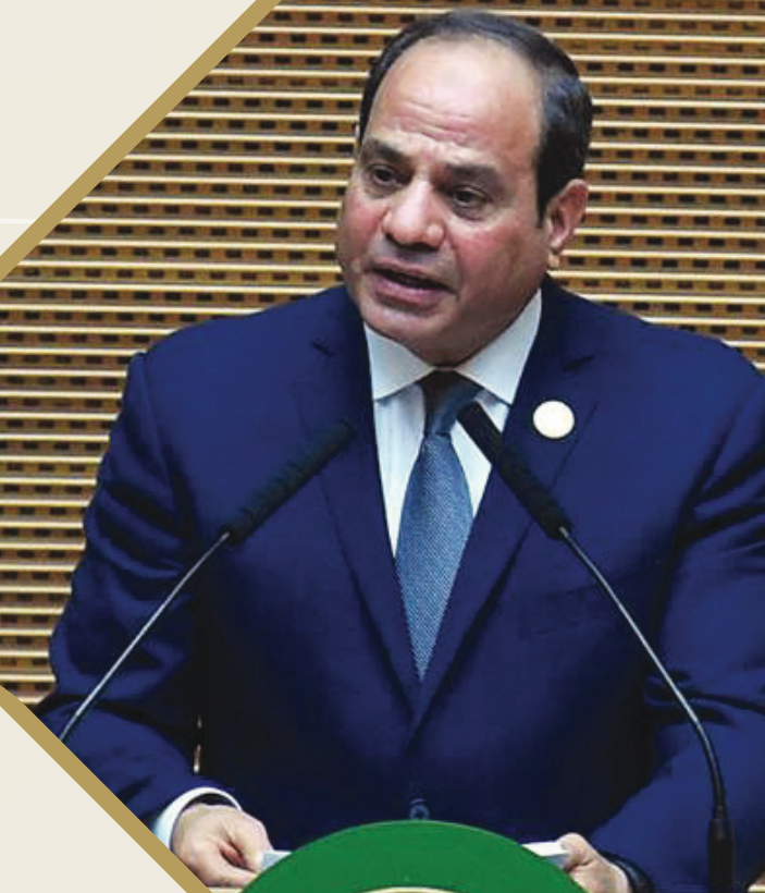
مصر تتراأس الاتحاد الأفريقي