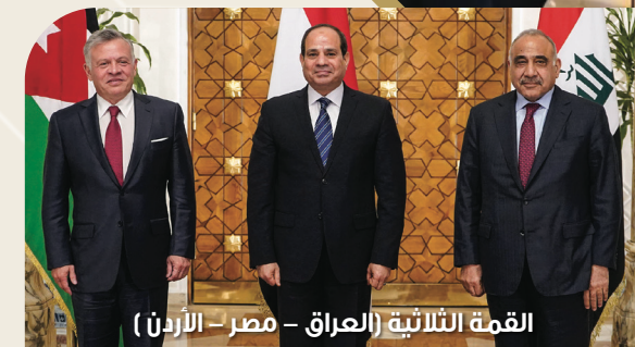
القمة الثلاثية (العراق - مصر - الأردن)