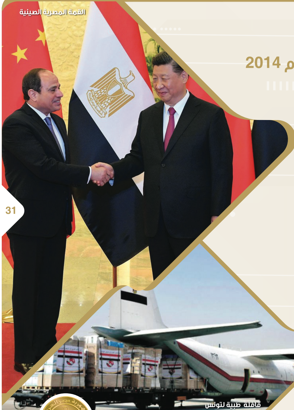
قافلة طبية لتونس

التعامل بشكل ناجح مع أزمة المصريين العالقين بالخارج وتسهيل استيراد المشتريات الأساسية من الأسواق العالمية خلال أزمة كورونا