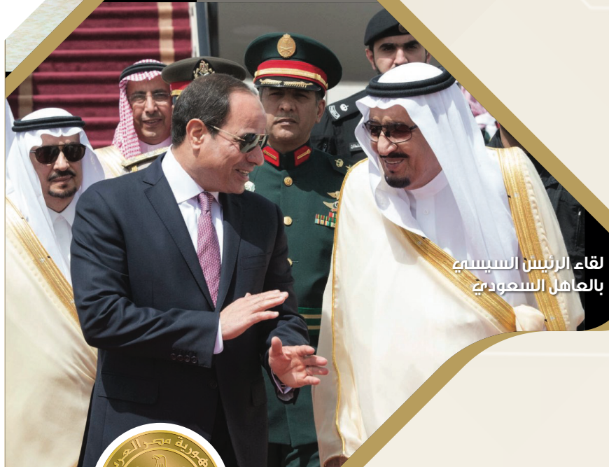
لقاء الرئيس السيسي بالعاهل السعودي

تحرص مصر على تقديم كل أوجه الدعم للسودان الشقيق وتنسيق المواقف المختلفة فيه ظل الروابط العميقة التي تربط البلدين