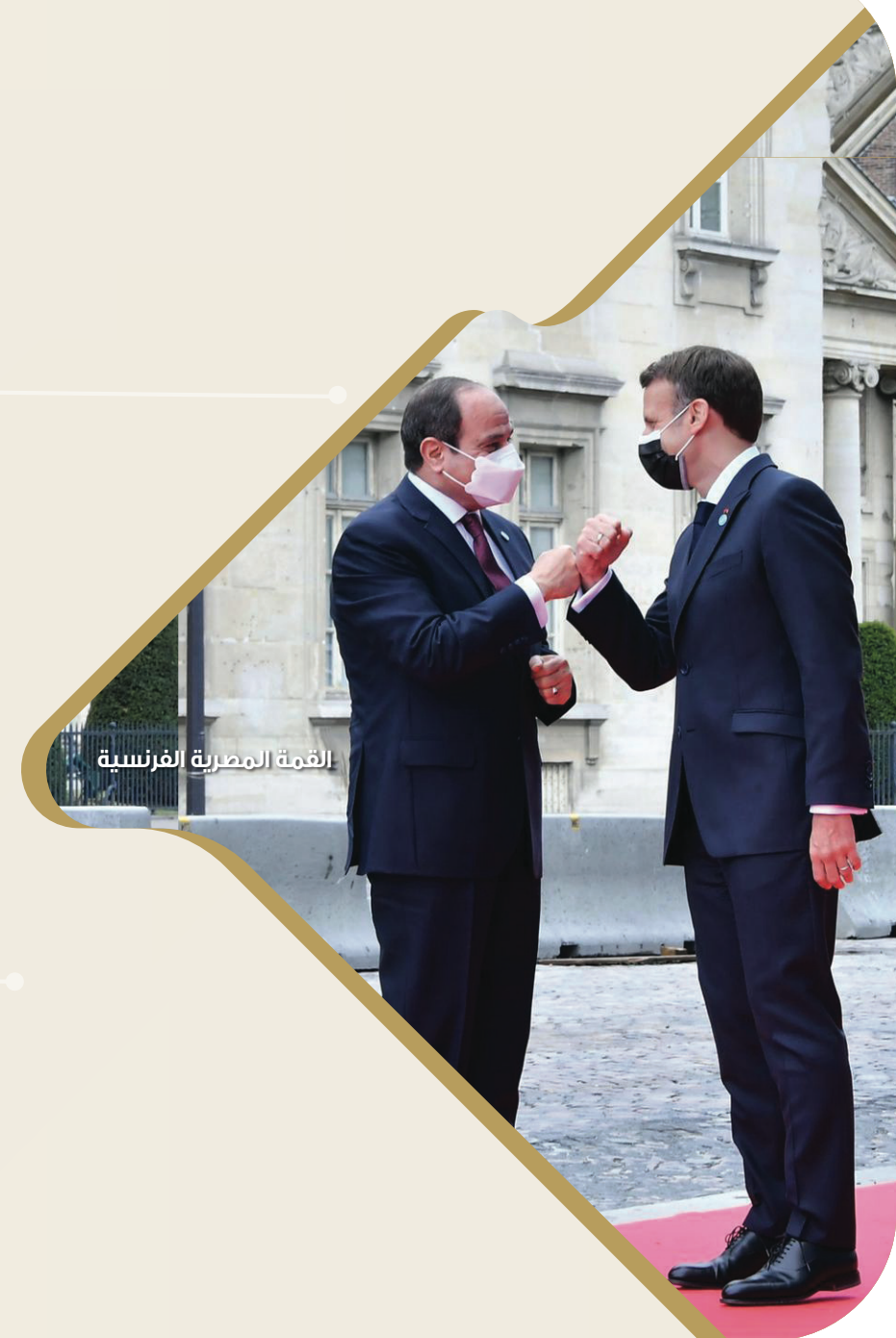
القمة المصرية الفرنسية