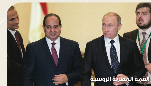
القمة المصرية الروسية