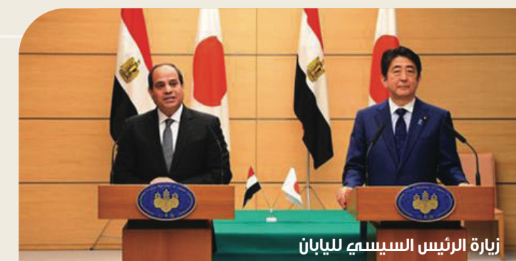
زيارة الرئيس السيسي لليابان