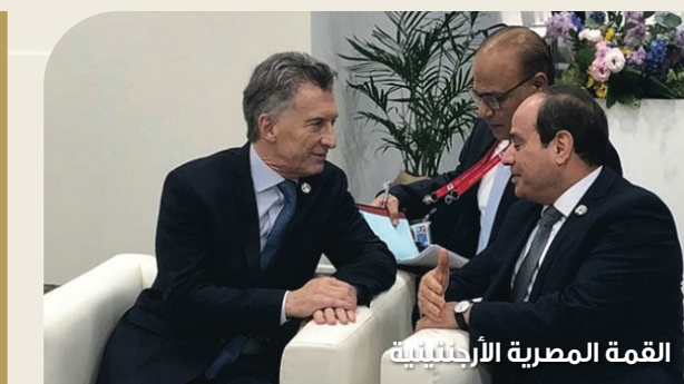
القمة المصرية الأرجنتينية