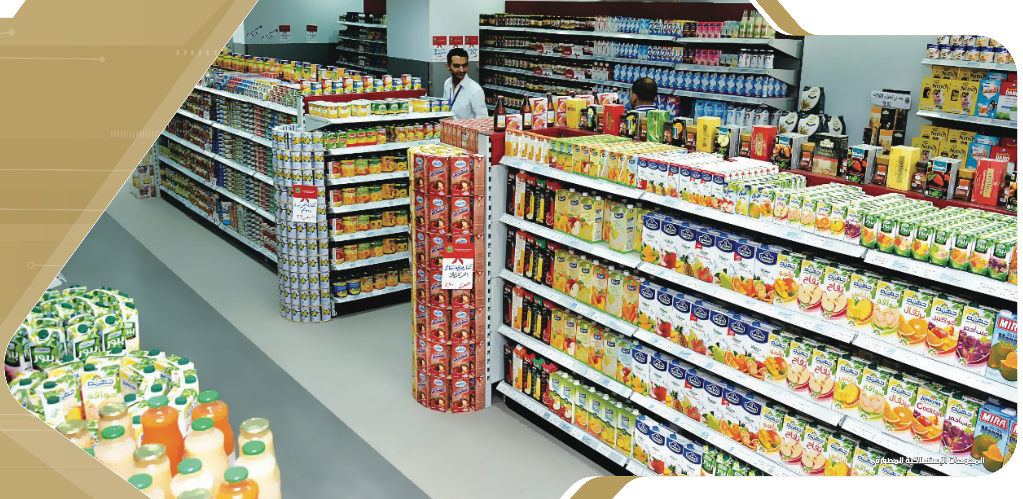
المجموعات الاستهلاكية المطورة

بتكلفة 23.2 مليار جنيه مشروعاً تم 236 وجار تنفيذه غير شاملة الدعم السلمي