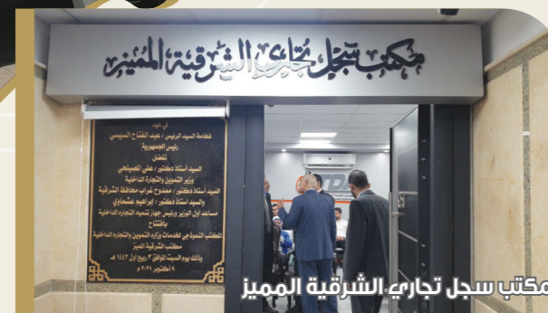
مكتب سجل تجاري الشرقية المميز