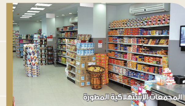
المجمعات الاستهلاكية المطورة