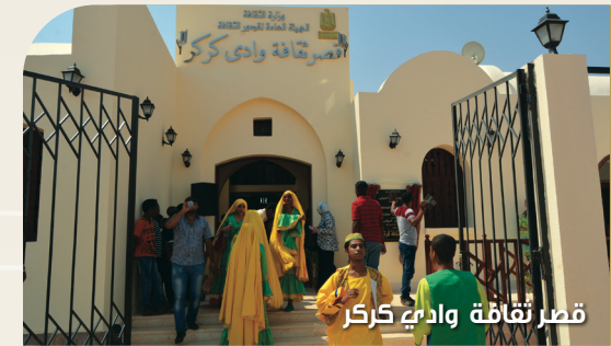
قصر ثقافة وادي كركر