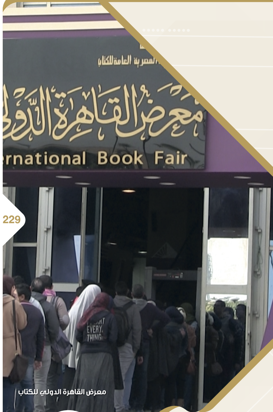
معرض القاهرة الدولي للكتاب