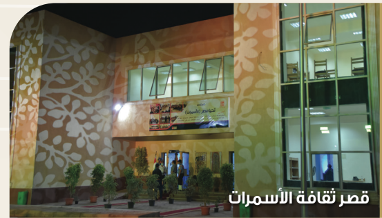
قصر ثقافة الأسمرات