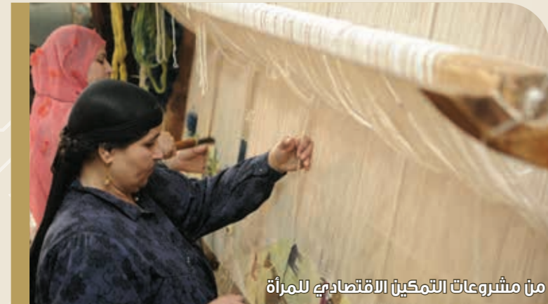
من مشروعات التمكين الاقتصادي للمرأة

9.2 مليار جنيه تكلفة القروض في الفترة من يوليو 2014 حتى يناير 2021.