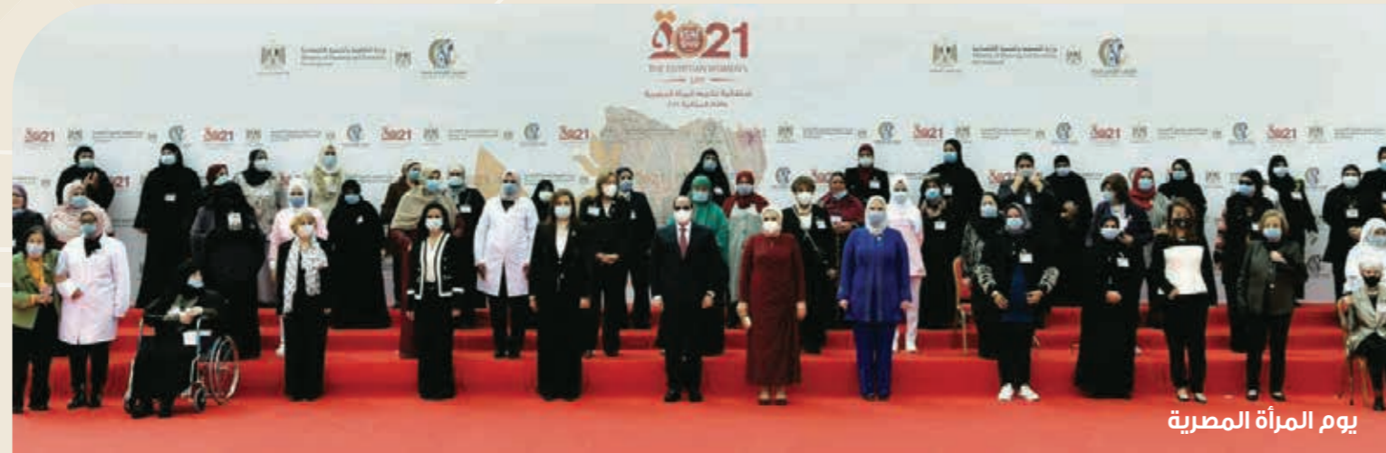
يوم المرأة المصرية