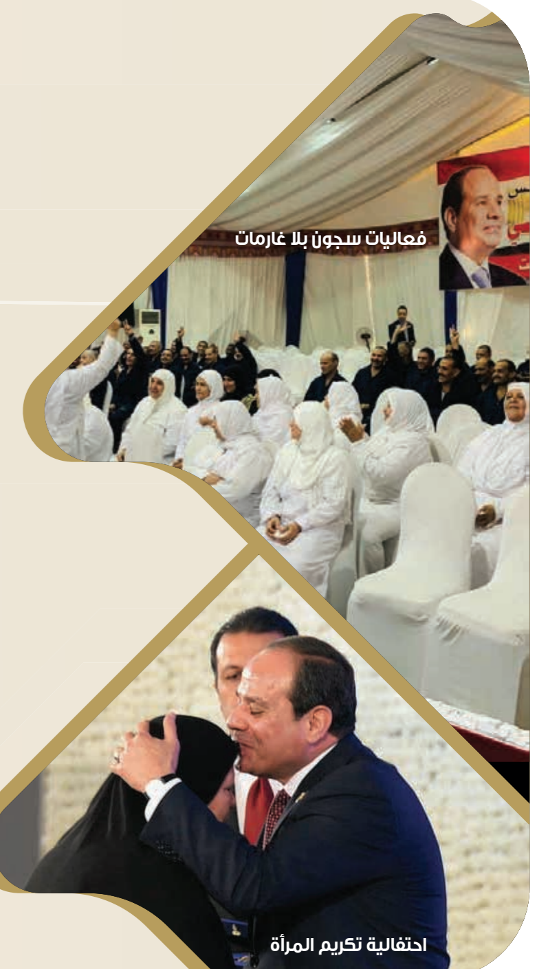
احتفالية تكريم المرأة