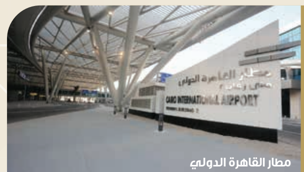
مطار القاهرة الدولي