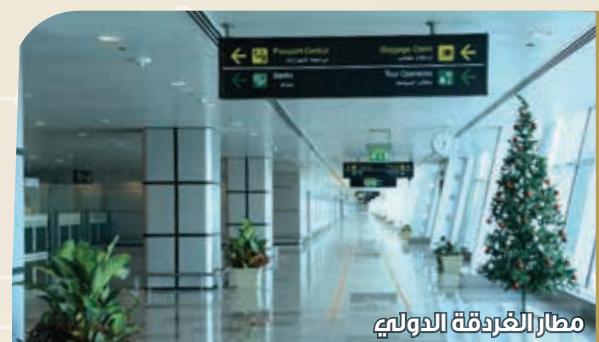
مطار الغردقة الدولي