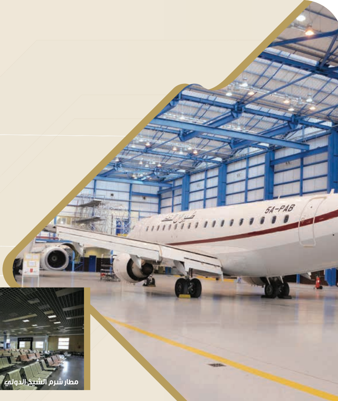
مطار القاهرة الدولي