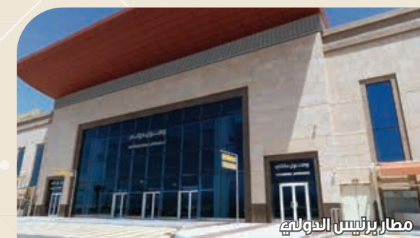
مطار برثيس الدولي