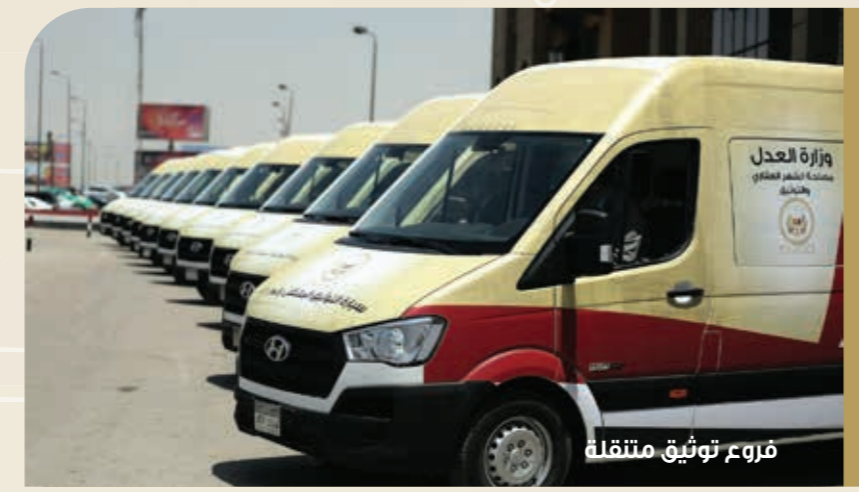
فروع توثيق متنقلة