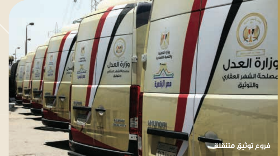
فروع توثيق متنقلة