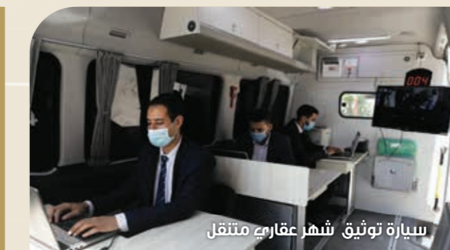
سيارة توثيق شهر عقاري متنقل