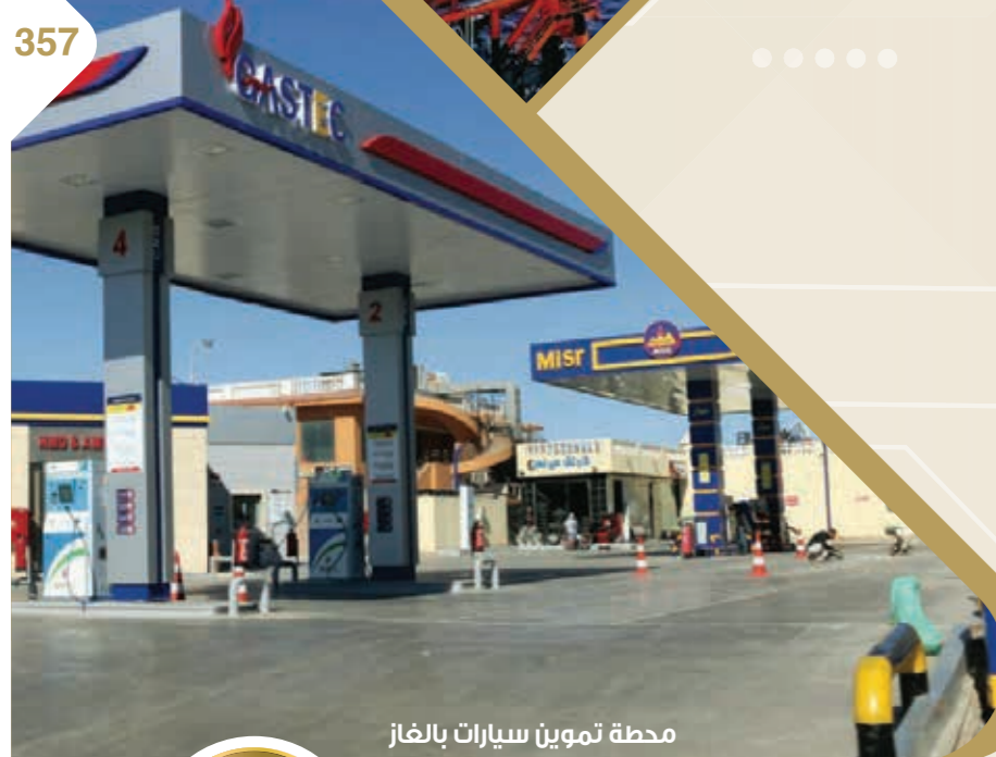
محطة تموين سيارات بالغاز الطبيعي بشرم الشيخ