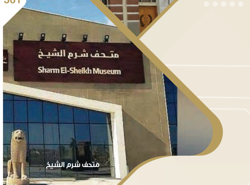
متحف شرم الشيخ