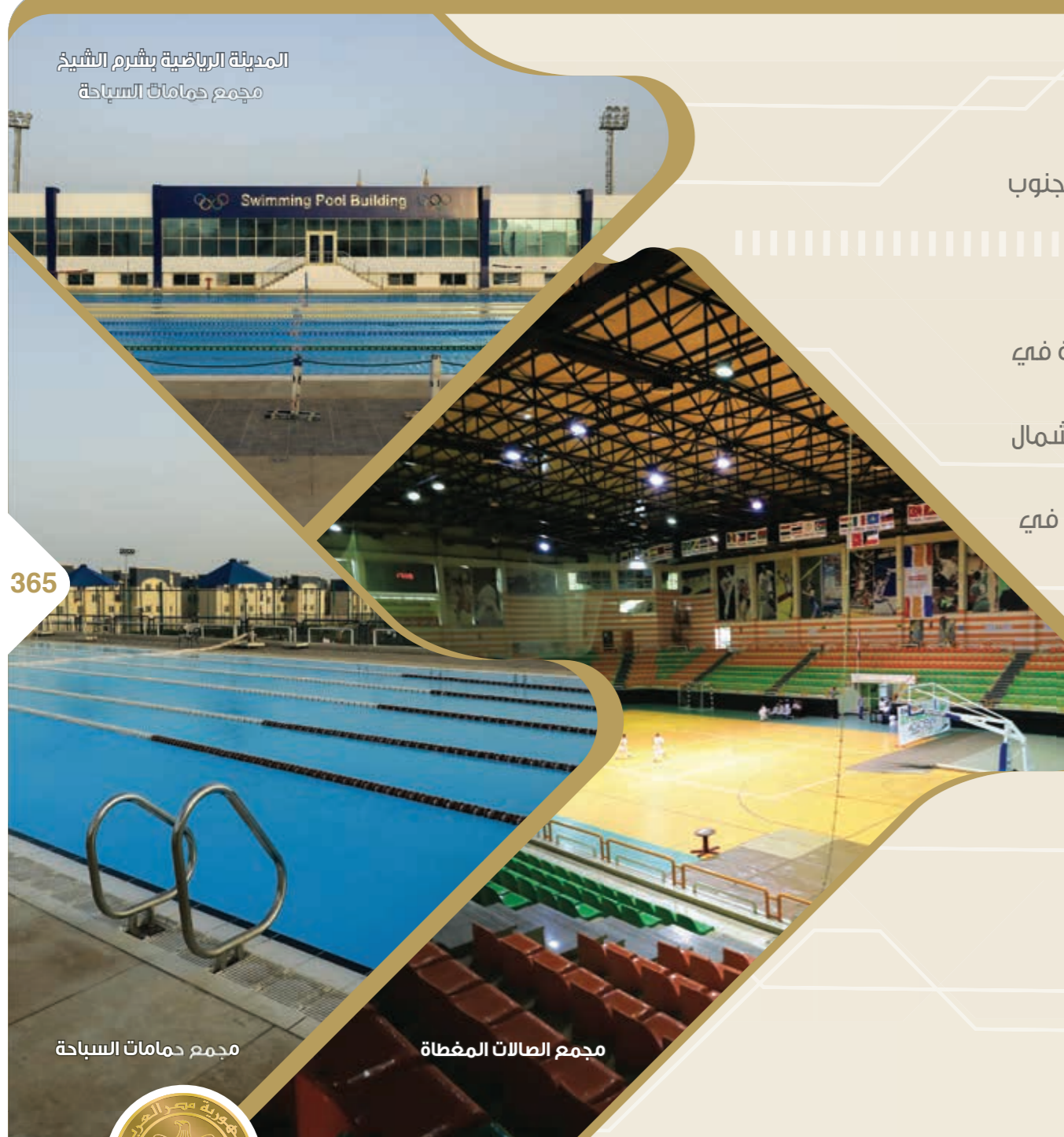
المدينة الرياضية بشرم الشيخ مجمع حمامات السباحة