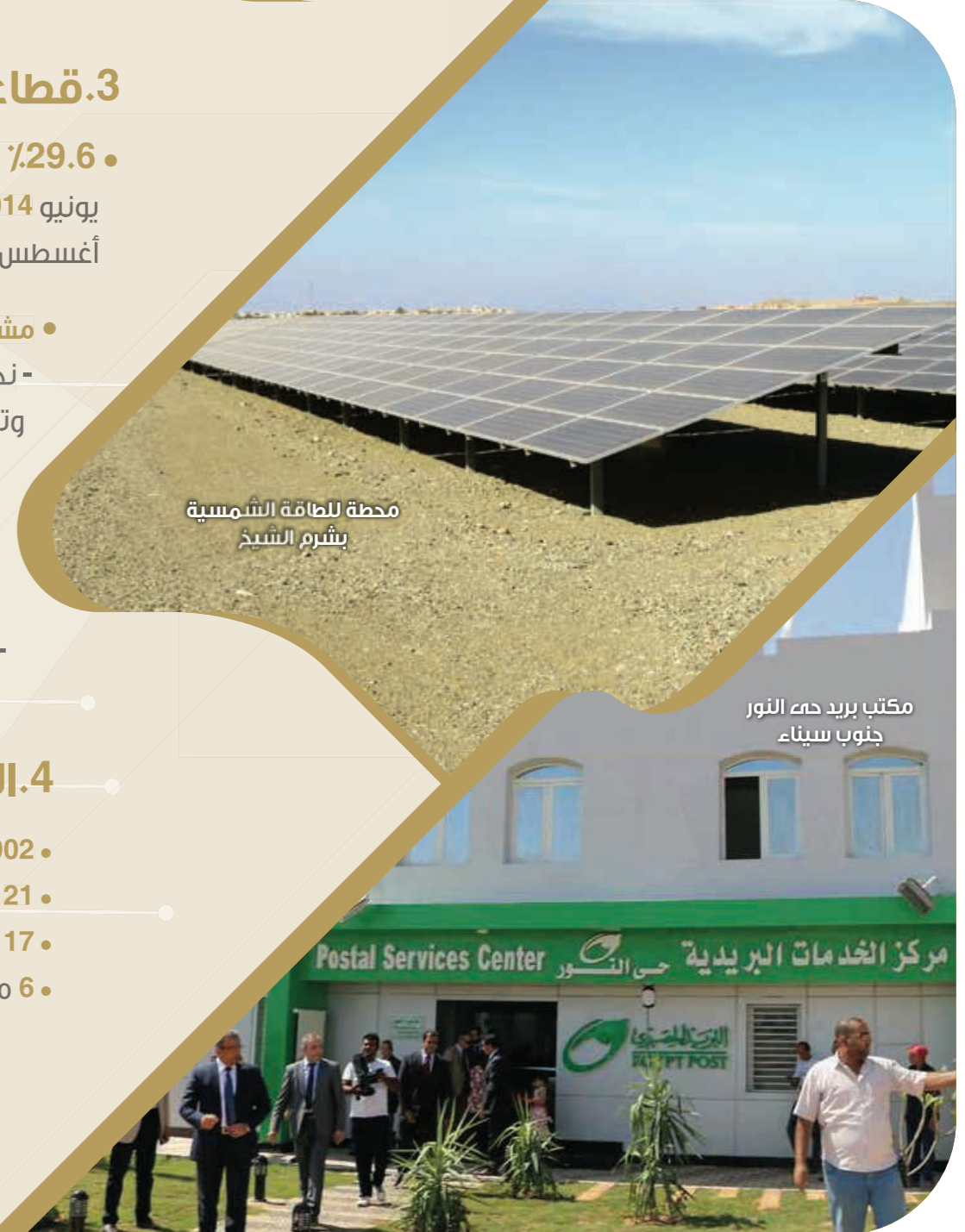
محطة للطاقة الشمسية بشيم الشيخ