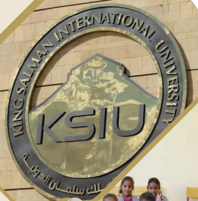
جامعة الملك سلمان