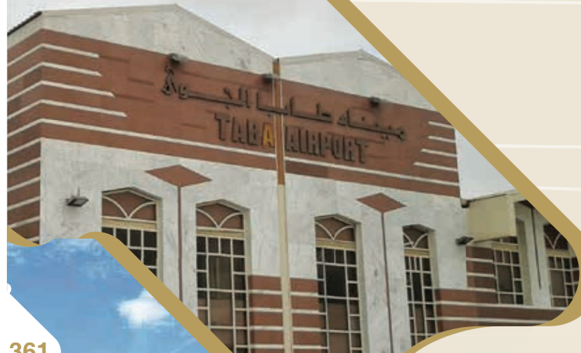
ميناء طابا الجوي

- لأول مرة منذ 11 عاماً استئناف تشغيل خط الطيران بين شرم الشيخ والأقصر