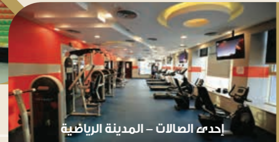
إحدى الصالات - المدينة الرياضية